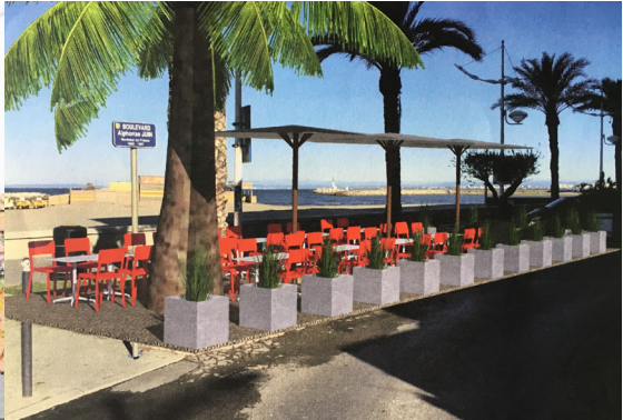
Exemple d'aménagement de terrasse commerciale